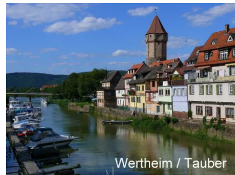
Wertheim / Tauber

Hier werden wir am Fuße des Mandelbergs in einer wunderschönen Naturlandschaft unser übliches Picknick veranstalten.